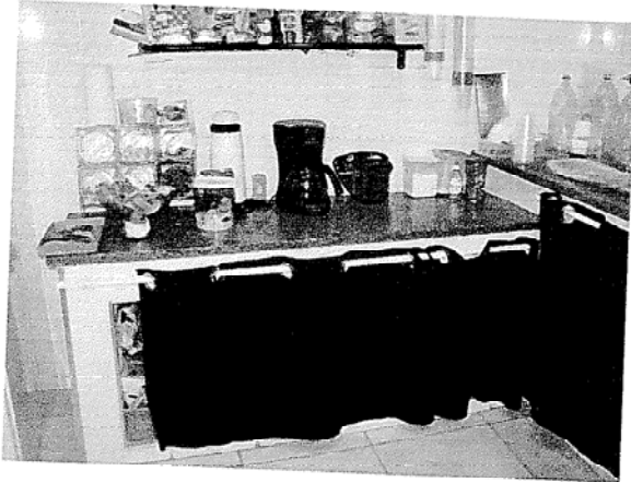
Figura 57 Cantina - Interior.