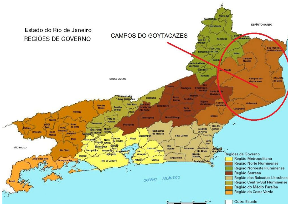
Figura 4-1 – Localização dos Municípios do Estado do Rio de Janeiro.

Local: Av. Alberto Lamego, 712 – Horto/ Campos de Goytacazes, região definida como Norte Fluminense do Estado do Rio de Janeiro. O referido Bairro tem em sua área de entorno divisa com os municípios de São João da Barra, São Francisco de Itabapua, Bom Jesus de Itabapua, Italva, Cardoso Moreira, São Fidelis, Sta. Maria Madalena, Conceição de Macacu, Quissamã e Estado do Espírito Santo. (Figura 4-1).