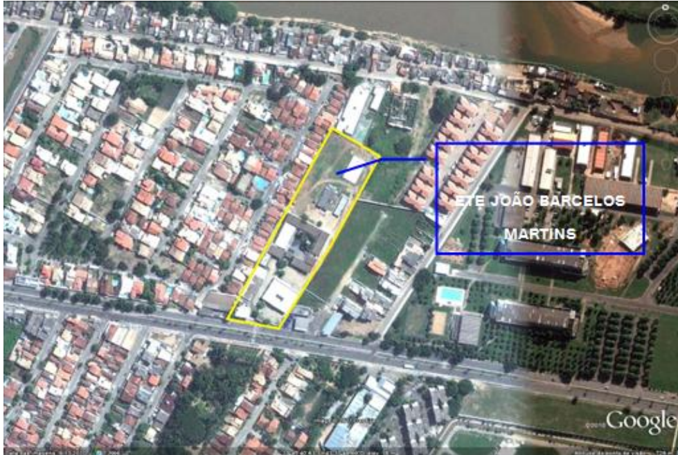
Figura 4-2 – Área do terreno da referida Unidade de Ensino.