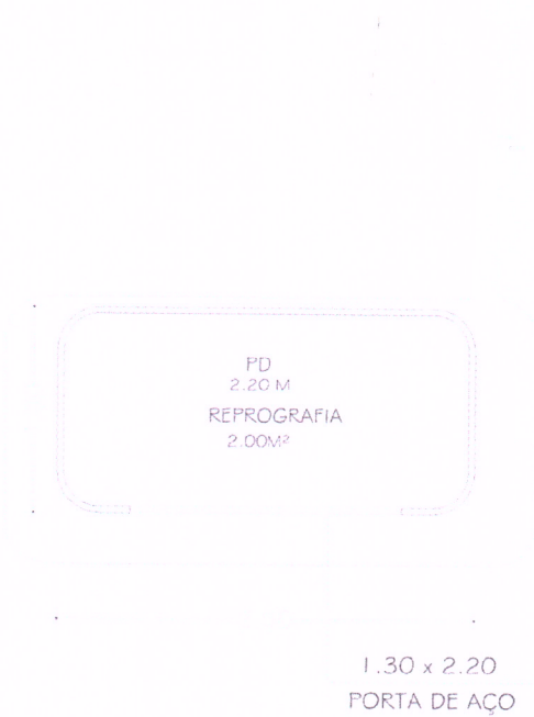
Figura 52 - Planta Baixa – Espaço Reprografia