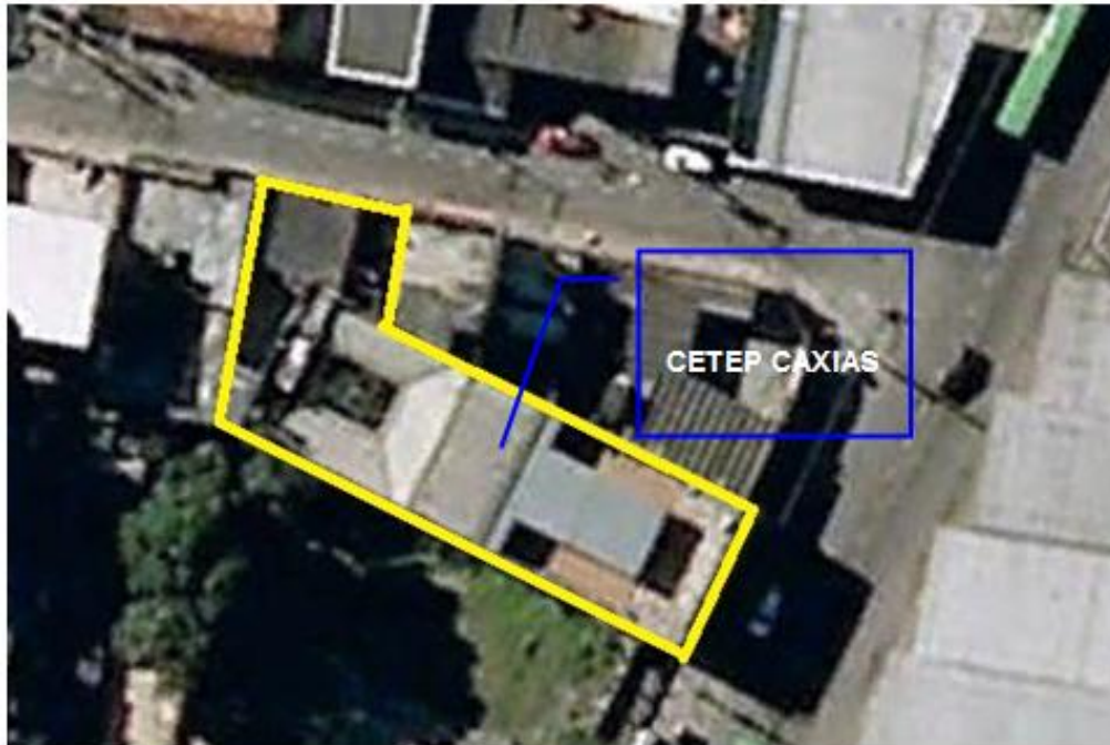
Figura 4-1 – Área do terreno da referida Unidade de Ensino.