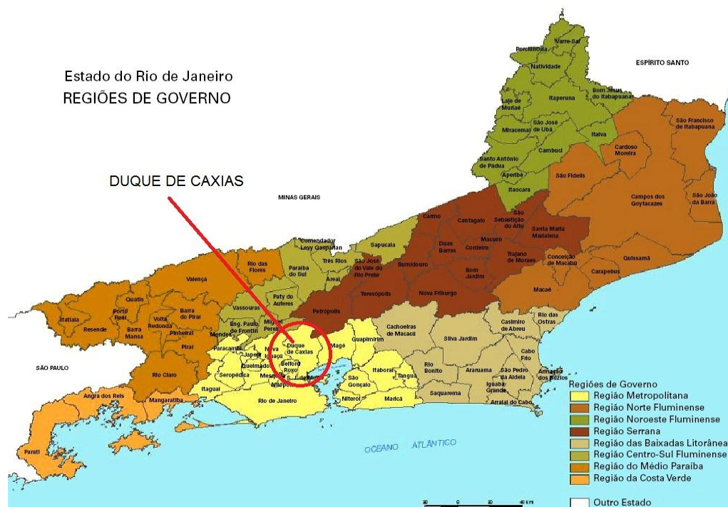
Figura 4-0 – Localização do Município. Mapa dos bairros e regiões administrativas do Rio de Janeiro.

Local: R. Pastor Belarmino Pedro Ramos, 89 – Duque de Caxias. O referido município faz divisa com os municípios de Magé, Petrópolis, Miguel Pereira, Nova Iguaçu e Belford Roxo (Figura 4-0).