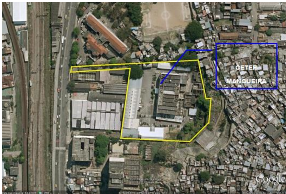
Figura 4-3 – Área do terreno da referida Unidade de Ensino.