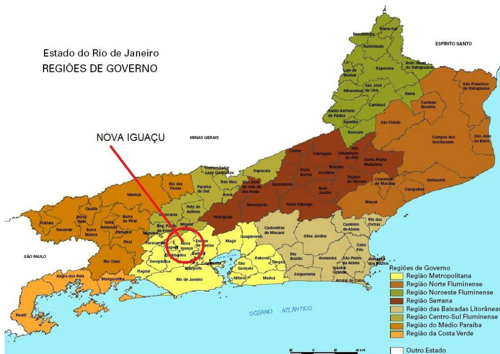
Figura 4-0 – Localização do município de Nova Iguaçu e entorno.

Local: R. Dr. Paulo Froes Machado, 38 - Centro/Nova Iguaçu, região definida como Metropolitana do Rio de Janeiro. O referido bairro tem em sua área de entorno divisa com os municípios de Belford Roxo, Duque de Caxias, Miguel Pereira, Japeri, Eng. Paulo de Frontain, Paracambi, Queimados e Nilópolis (Figura 4-1).