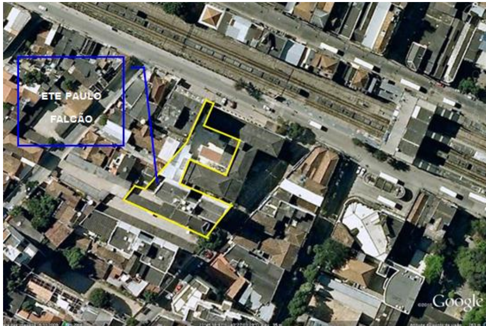
Figura 4-3 – Área do terreno da referida Unidade de Ensino.