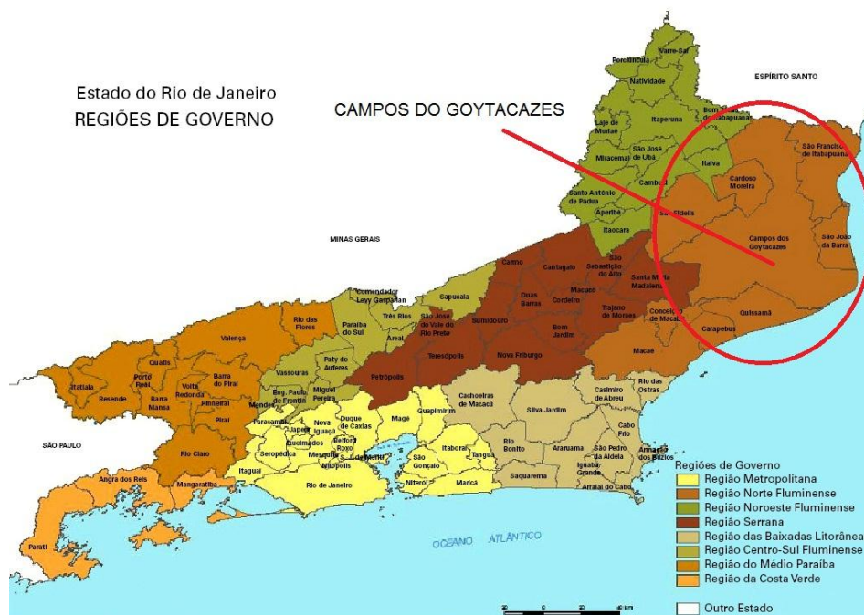
Figura 4-1 – Localização dos Municípios do Estado do Rio de Janeiro. (Fonte: www.rio.rj.gov.br/web/smu )

Local: R. Wilson Batista s/n. Parque Aldeia/Campos de Goytacazes, região definida como Norte Fluminense do Estado do Rio de Janeiro. O referido Bairro tem em sua área de entorno divisa com os municípios de São João da Barra, São Francisco de Itabapua, Bom Jesus de Itabapua, Itaiva, Cardoso Moreira, São Fidelis, Sta. Maria Madalena, Conceição de Macacu, Quissamã e Estado do Espírito Santo. (Figura 4-1).