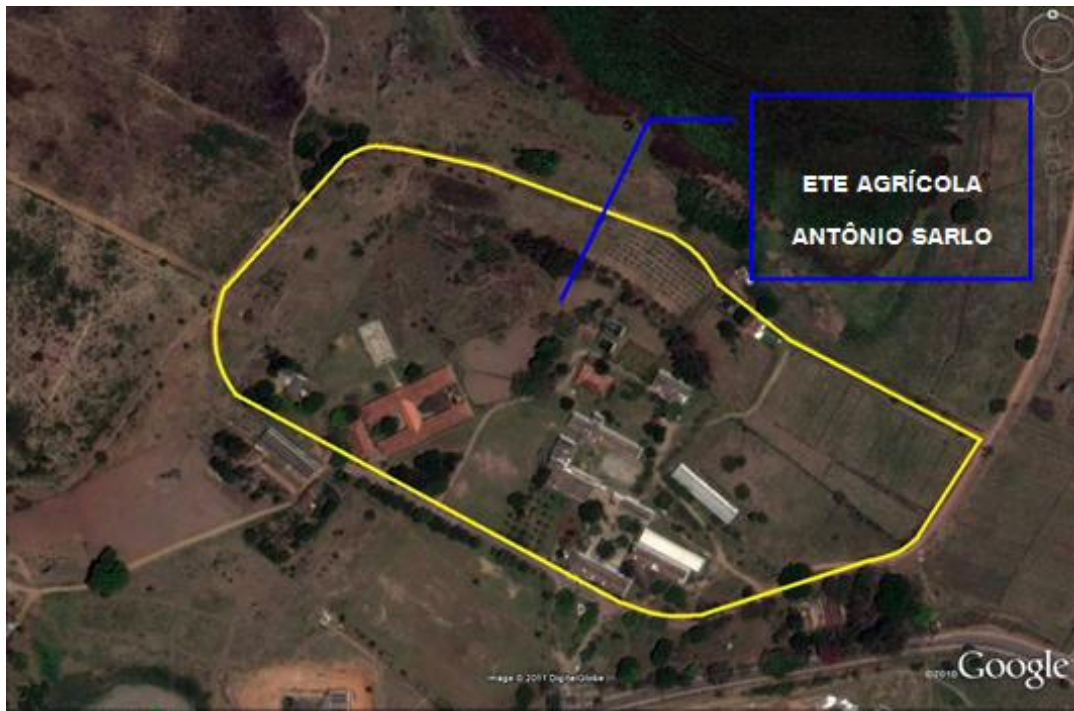
Figura 4-2 – Área do terreno da referida Unidade de Ensino.