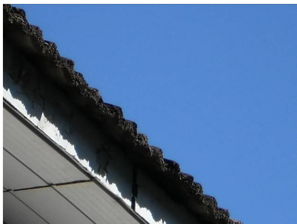
fig. 07 Telha francesa deteriorada.