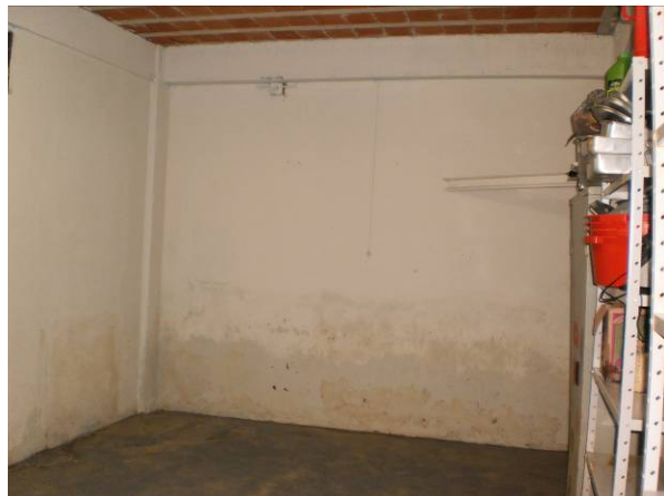
fig. 02 Paredes úmidas e sujas.