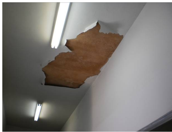
fig. 04 Infiltração no teto em vários pontos do CETEP.

DIENG - Divisão de Engenharia Rua Clarimundo de Melo, 847 - Quintino - CEP 21311-280 - (21) 2332-4045 / 2332-4111 diengfaetec@gmail.com www.faetec.rj.gov.br/deam