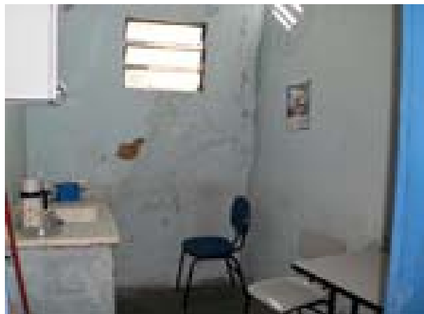
Fig. 14 Parede da copa com infiltração.