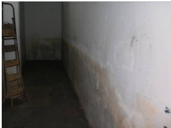
fig. 01 Manchas causada pela enchente.