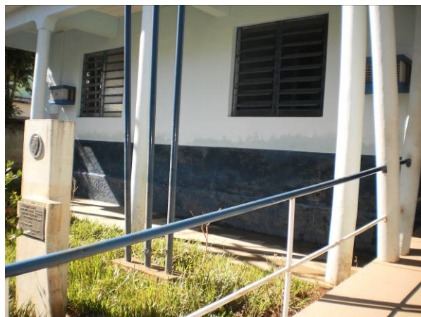
fig.16 Fachada principal.

DIENG - Divisão de Engenharia Rua Clarimundo de Melo, 847 - Quintino - CEP 21311-280 - (21) 2332-4045 / 2332-4111 diengfaetec@gmail.com www.faetec.rj.gov.br/deam