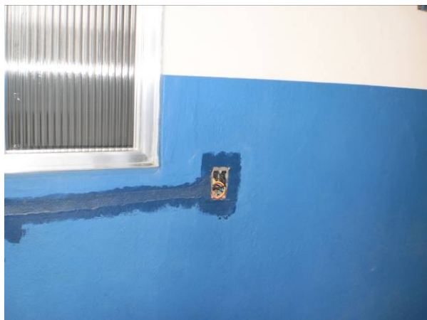
fig. 15 Ausência de espelho nas tomadas.