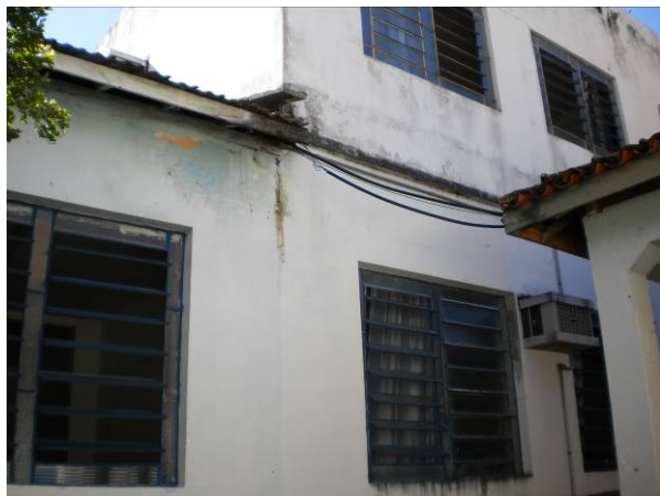
fig. 13 Ausência de beiral.