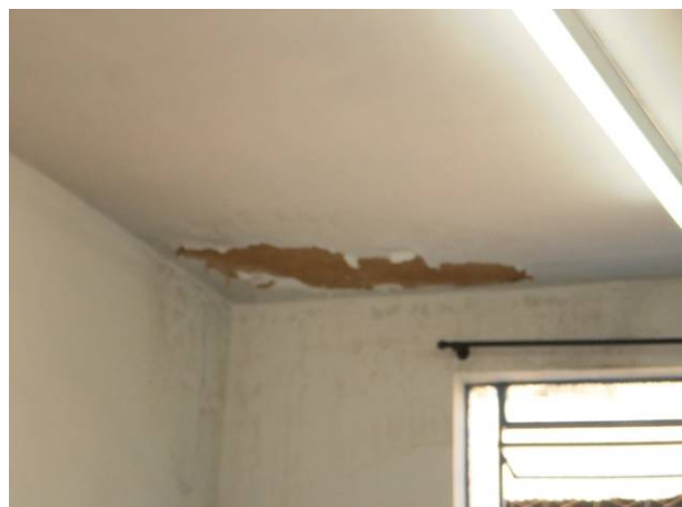
fig. 03 Infiltração devido a danos no telhado.