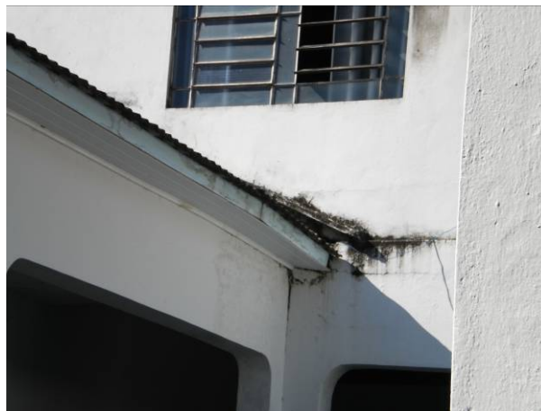
fig. 06 Rufo danificado.