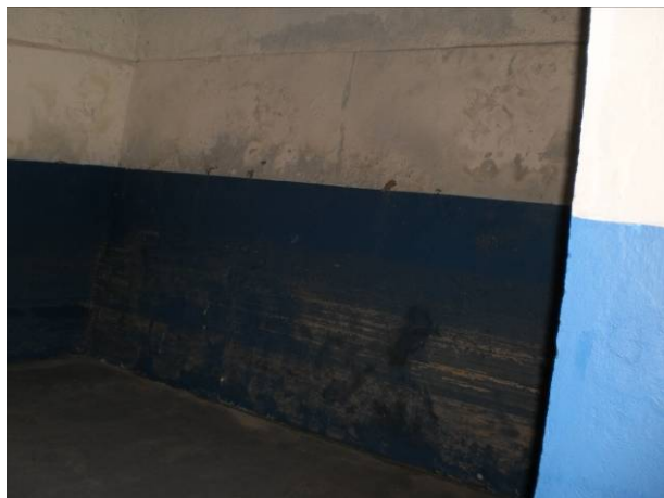
Fig.09 Sala de aula com parede úmida.