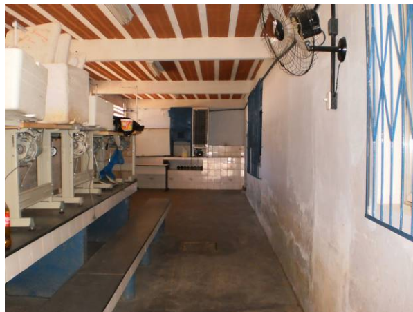
fig. 10 Refeitório ainda com as marcas da enchente.