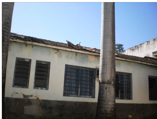
Fig 12 Fachada lateral.