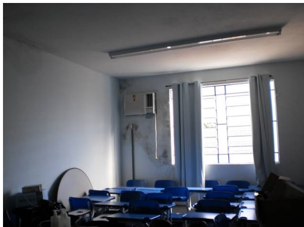
fig. 05 Infiltração em volta do ar condicionado.