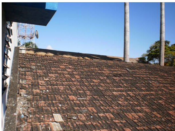
fig. 11 Telhado ainda com muitas telhas quebradas.