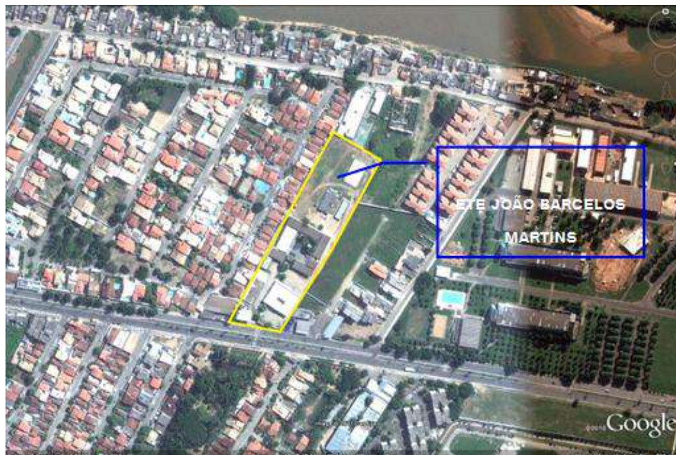
Figura 4-2 – Área do terreno da referida Unidade de Ensino.