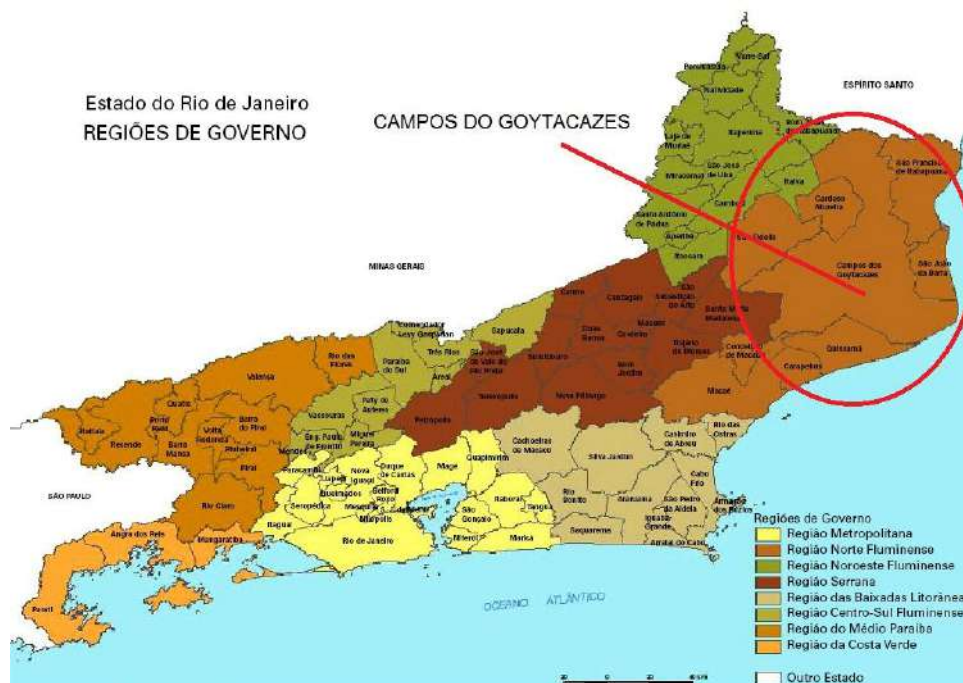
Figura 4-1 – Localização dos Municípios do Estado do Rio de Janeiro.

Local: Av. Alberto Lamego, 712 – Horto/ Campos de Goytacazes, região definida como Norte Fluminense do Estado do Rio de Janeiro. O referido Bairro tem em sua área de entorno divisa com os municípios de São João da Barra, São Francisco de Itabapua, Bom Jesus de Itabapua, Italva, Cardoso Moreira, São Fidelis, Sta. Maria Madalena, Conceição de Macacu, Quissamã e Estado do Espírito Santo. (Figura 4-1).