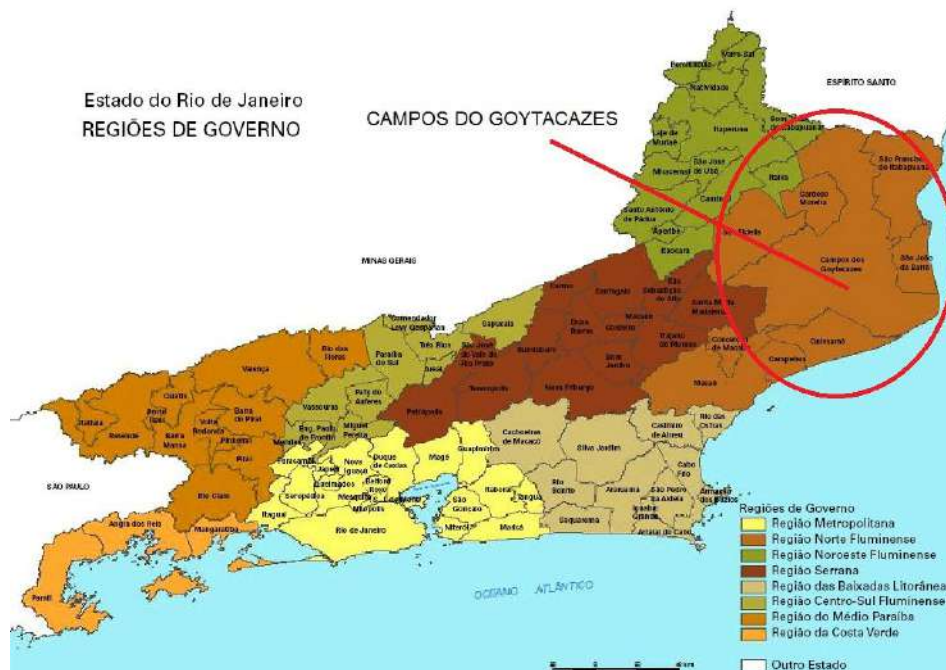
Figura 4-1 – Localização dos Municípios do Estado do Rio de Janeiro.

Local: R. Wilson Batista s/n. Parque Aldeia/Campos de Goytacazes, região definida como Norte Fluminense do Estado do Rio de Janeiro. O referido Bairro tem em sua área de entorno divisa com os municípios de São João da Barra, São Francisco de Itabapua, Bom Jesus de Itabapua, Itaiva, Cardoso Moreira, São Fidelis, Sta. Maria Madalena, Conceição de Macacu, Quissamã e Estado do Espírito Santo. (Figura 4-1).