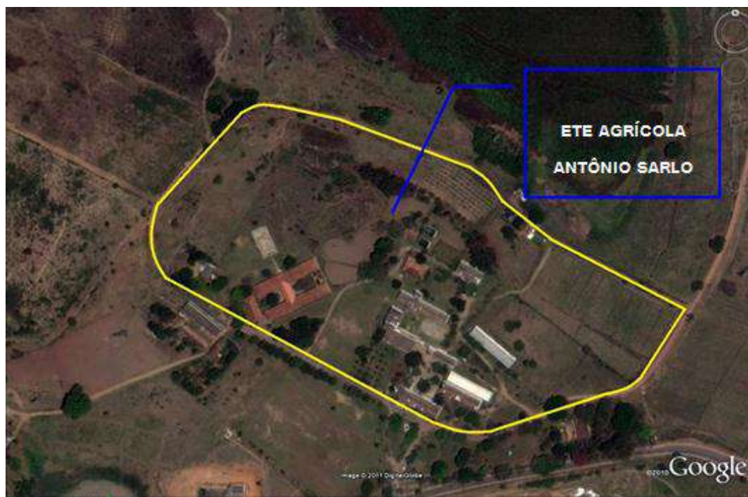
Figura 4-2 – Área do terreno da referida Unidade de Ensino.