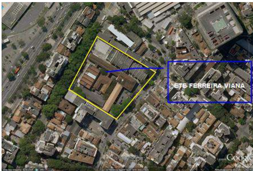
Figura 4-2 – Área do terreno da referida Unidade de Ensino.