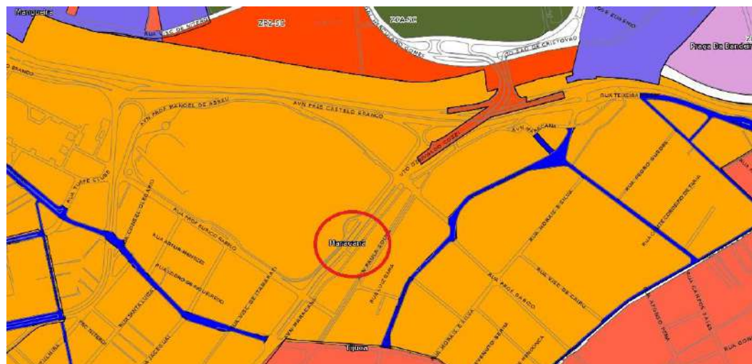
Figura 4-1 – Localização do Bairro e entorno. Mapa dos bairros e regiões administrativas do Rio de Janeiro.

A R General Canabarro, 291, local dos objetos de avaliação, pertencente a zona Residencial/Casa de padrão simples a médio, e é servida por melhoramentos e serviços públicos e possui infra-estrutura básica e transporte