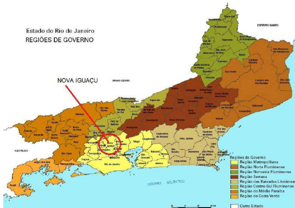
Figura 4-0 – Localização do município de Nova Iguaçu e entorno.

Local: R. Dr. Paulo Froes Machado, 38 - Centro/Nova Iguaçu, região definida como Metropolitana do Rio de Janeiro. O referido bairro tem em sua área de entorno divisa com os municípios de Belford Roxo, Duque de Caxias, Miguel Pereira, Japeri, Eng. Paulo de Frontain, Paracambi, Queimados e Nilópolis (Figura 4-1).