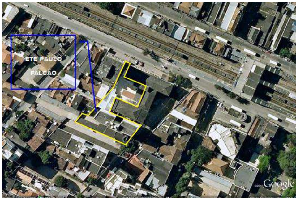
Figura 4-3 – Área do terreno da referida Unidade de Ensino.