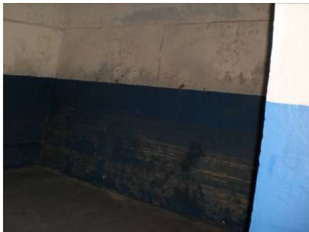
Fig.09 Sala de aula com parede úmida.