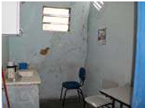
Fig. 14 Parede da copa com infiltração.