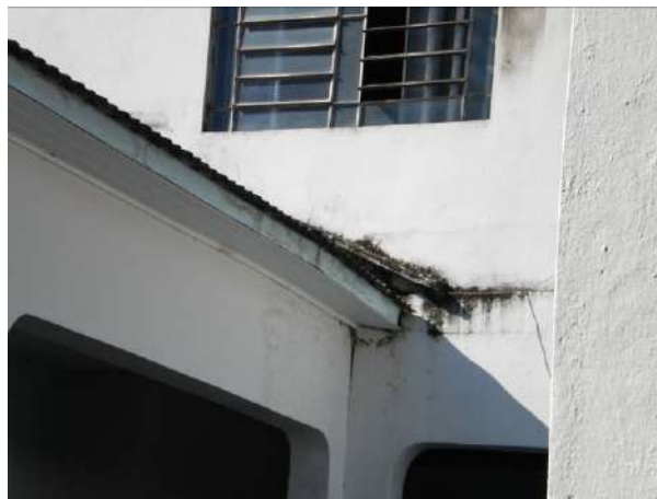
fig. 06 Rufo danificado.