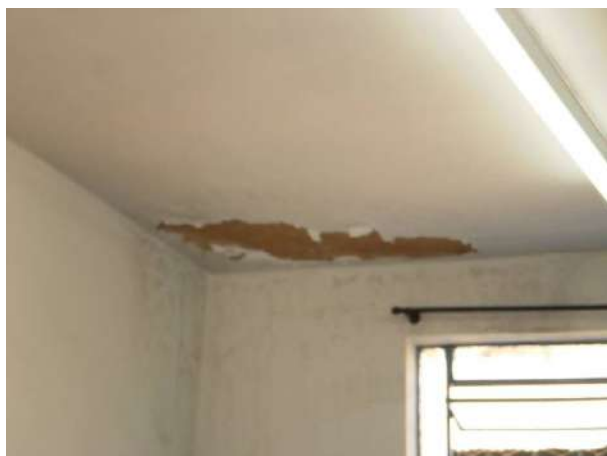
fig. 03 Infiltração devido a danos no telhado.