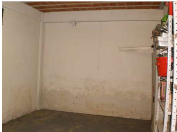
fig. 02 Paredes úmidas e sujas.