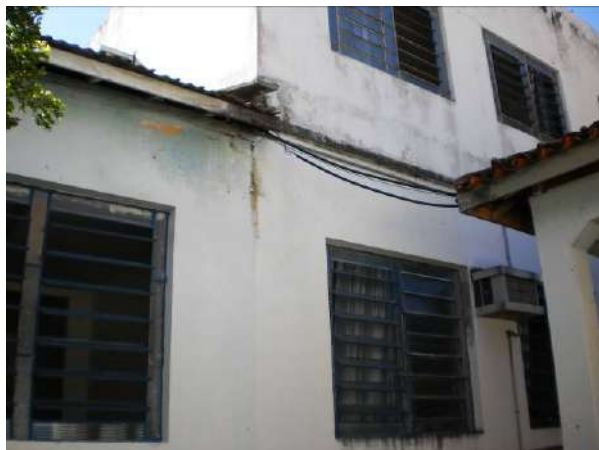
fig. 13 Ausência de beiral.