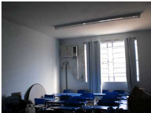
fig. 05 Infiltração em volta do ar condicionado.