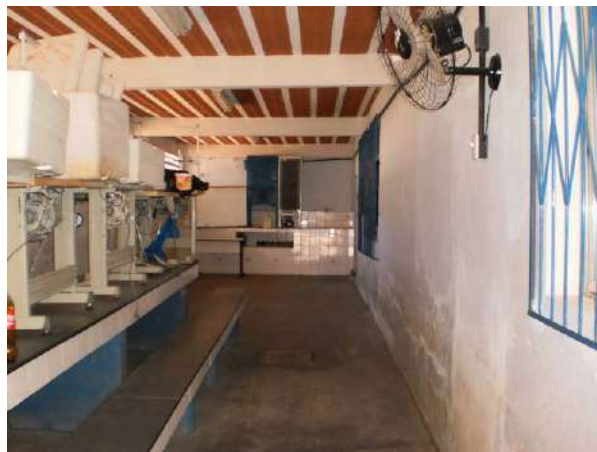
fig. 10 Refeitório ainda com as marcas da enchente.