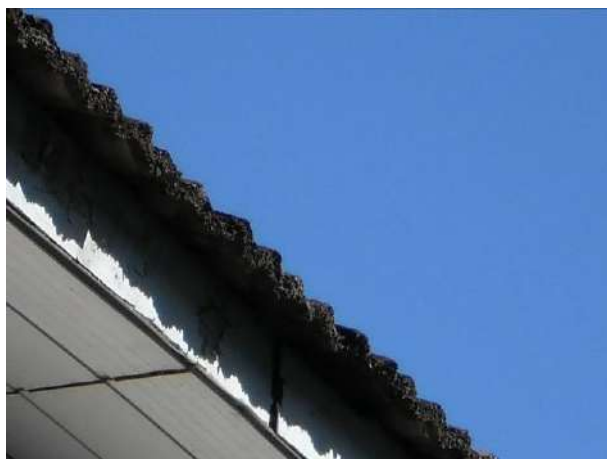
fig. 07 Telha francesa deteriorada.