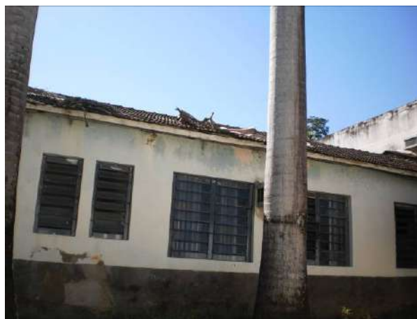
Fig 12 Fachada lateral.