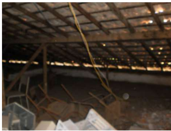
fig. 08 Cobertura com entulho e telhas fora do lugar.