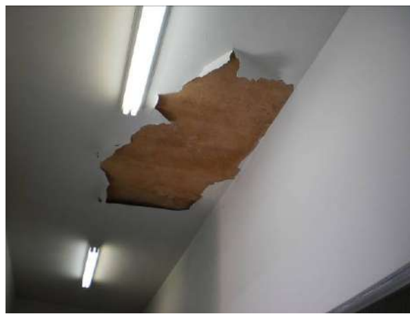
fig. 04 Infiltração no teto em vários pontos do CETEP.