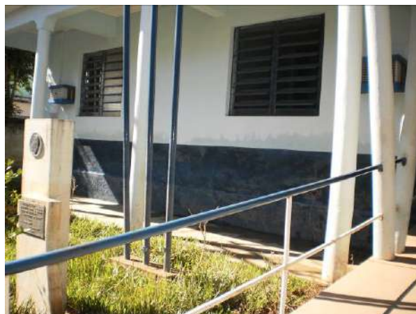
fig.16 Fachada principal.