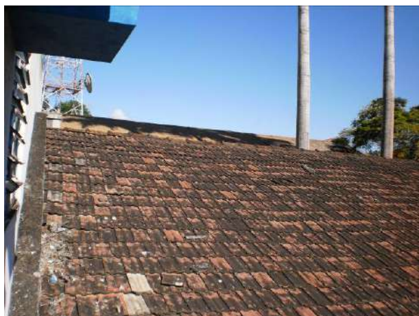
fig. 11 Telhado ainda com muitas telhas quebradas.