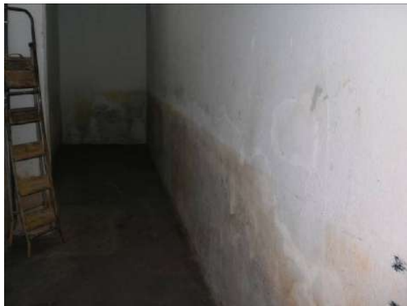
fig. 01 Manchas causadas pela enchente.